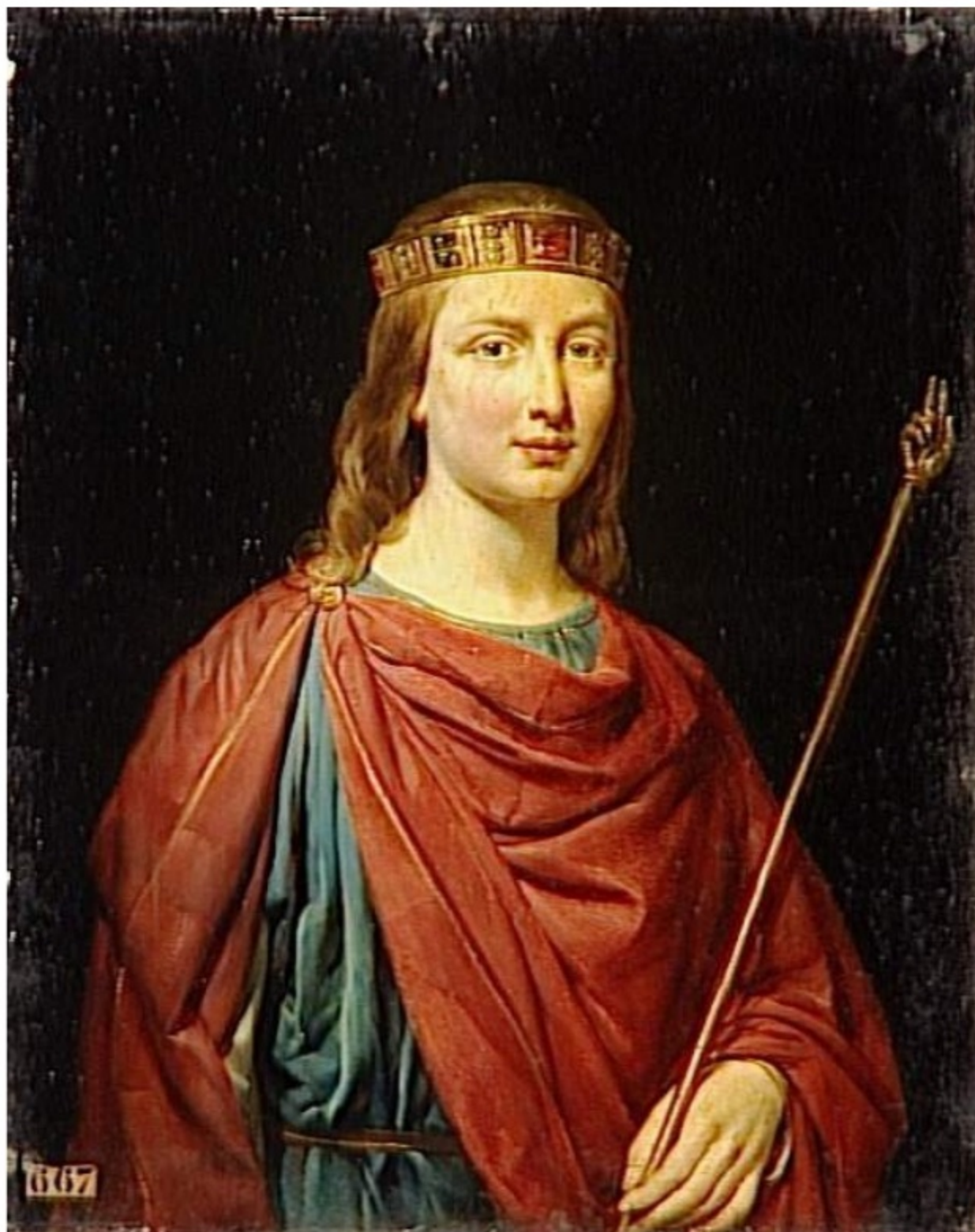
Clovis III roi d'Austrasie en 691 (682-695)