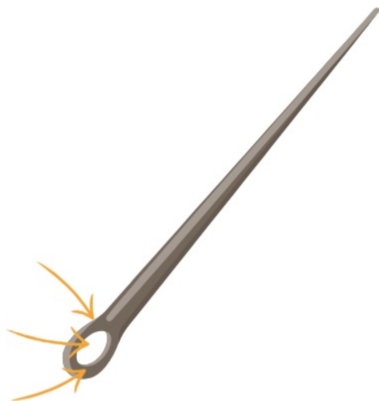
LE CHAS (DE L' AIGUILLE)